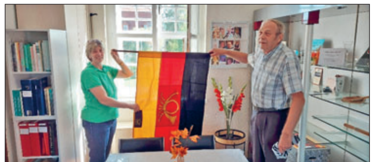
Die Fahne der Deutschen Post findet neuen Platz im Heimatverein